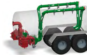
Funktionsprinzip „Rühren“ beim TwinFlow-System