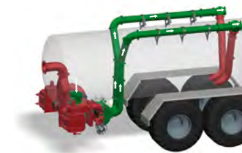
Funktionsprinzip „Ausbringen“ beim TwinFlow-System