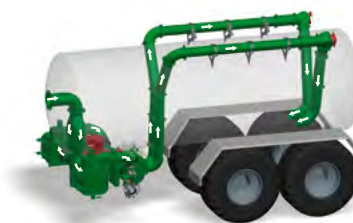
Funktionsprinzip „Befüllen“ beim TwinFlow-System

Holen Sie mit unserem TwinFlow-System das Maximum aus unseren leistungsstarken Drehkolbenpumpen heraus. Mit zwei Ansaug- und Druckleitungen kann das volle Leistungspotential bis zu 14.000 Liter pro Minute erreicht werden. Zwei Schneidwerkseinrichtungen sorgen komfortabel für einen Schutz der Pumpe und garantieren Verstopfungsfreiheit an der Applikationstechnik. Ein weiteres Plus ist die servicefreundliche Positionierung der Pumpe.