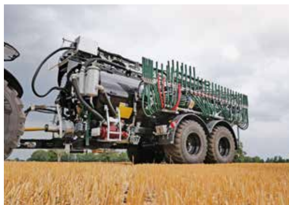
Rampe pendillards Vogelsang SwingMax 24 m

Vous avez le choix entre trois modèles de rampes pendillards de Vogelsang pour une utilisation professionnelle : Avec le SwingUp, le SwingMax ou le SwingMax36, vous êtes sûr d'obtenir la technique qui correspond exactement à vos exigences et à vos processus d'exploitation.