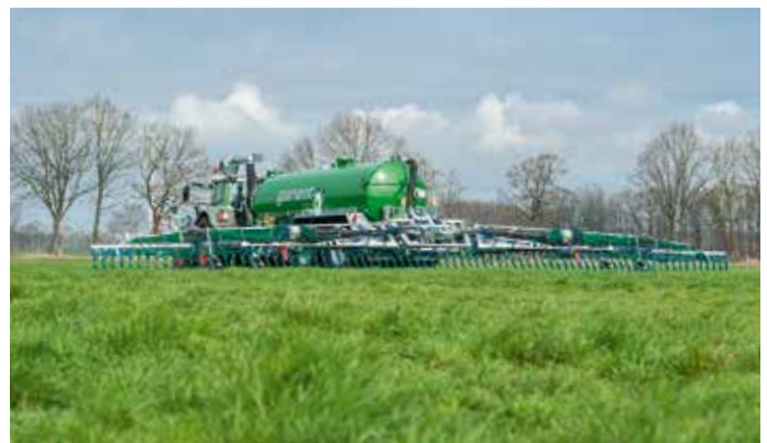
Rampe à patins BOMECH Multi 21 m

Avec leurs châssis bien conçus, une gestion intelligente des tronçons de rampe et des têtes de répartition à usure optimisée, elles répondent aux exigences de qualité les plus élevées. BOMECH propose différents modèles avec des largeurs de travail allant de 5,3 à 30 mètres.