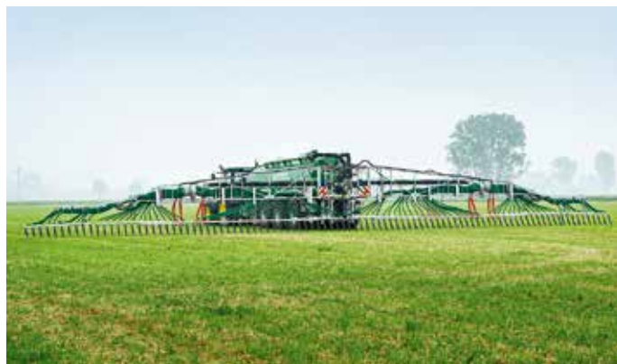
Rampe à patins Vogelsang SwingMax Slide 30 m

La rampe à patins SwingMax Slide se distingue par un excellent rapport qualité/prix. Par rapport au rampe pendillards Vogelsang, cette technique vous permet d'atteindre une efficacité encore plus élevée en matière de substances nutritives.